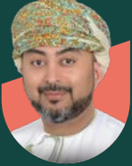
• خالد المحروقي مدير عام التطوير العقاري بوزارة الإسكان والتخطيط العمراني