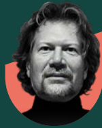
• باولو زيللي مدير مساعد | زها حديد