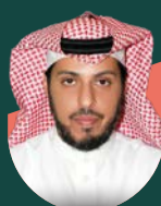
• Abdullatif Al Qahaidan Ministry of Housing in Saudia Arabia