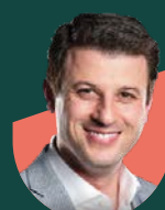
• Ahmed Fakhuri Media