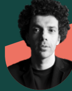
• د. كارميلو زابولا شركة External Reference