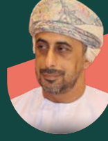
• سعادة. مسعود الهاشمي محافظ جنوب الباطنة