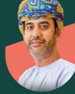
• سعادة . حمد الزواني وكيل وزارة الإسكان والتخطيط العمراني للإسكان