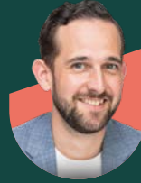
• اولي برادلي برنارد معماري | Chapman Taylor