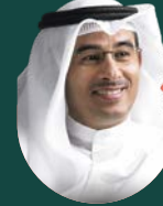
• محمد العبار المؤسس شركة إعمار