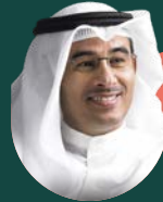
• Mohamed Al Abbar Founder | EMAAR