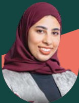
• لما الخضوري وزارة الإسكان والتخطيط العمراني