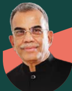
• بي أن سي مينون المؤسس شركة شوبا